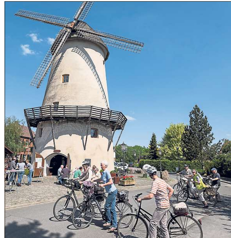
Ein beliebter Treffpunkt für Radfahrer war auch die Windmühle in Westkirchen gestern am Deutschen Mühlentag.