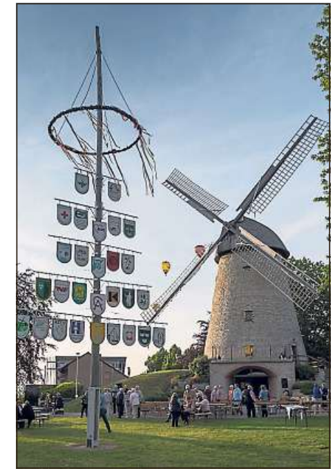
Der Maibaum an der Ennigerloher Windmühle steht seit Samstagabend wieder.