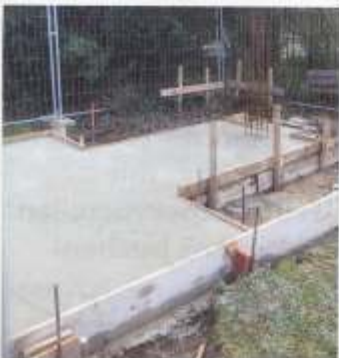
Der Grundriss des Backhauses ist nach dem Gießen der Bodenplatte schon zu erkennen

Auf der Internetseite www.muehlenfreunde-ennigerloh.de